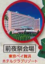
前夜祭会場 東京ベイ舞浜 ホテルクラブリゾート

天慶3年(940年)に開山した関東三大不動の一つ。境内には、額堂や光明堂、釈迦堂、仁王門、三重塔(すべて重要文化財)が点在しています。