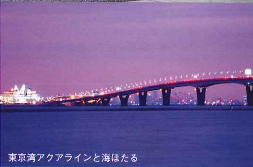
東京湾アクアラインと海ほたる