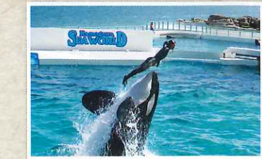
H 鴨川シーワールド

「清水溪流広場」の遊歩道にある話題のスポット。洞窟内部に差し込む光や澄んだ滝の流れが演出する幻想的な風景が見られます。