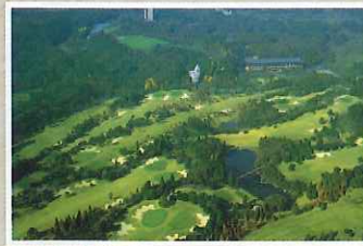
J 真名カントリークラブ

千葉県を代表する「ホテル三日月グループ」の3施設にある開運の湯「黄金風呂」。エクスカッションで楽しめます。