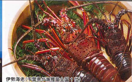
伊勢海老(千葉県が漁獲量全国1位)