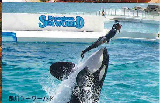
鴨川シーワールド