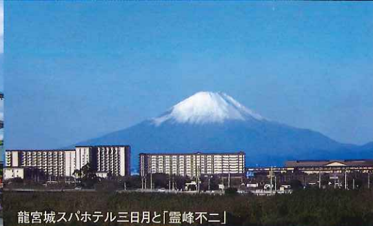
龍宮城スパホテル三日月と「霊峰不二」