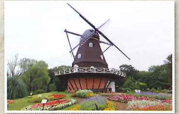
B ふなばしアンデルセン公園

徳川慶喜の弟・昭武が明治17年に建てた屋敷。国指定名勝の美しい庭に面した建物は国の重要文化財に指定されています。