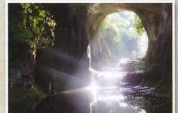
G 濃溝の滝・亀岩の洞窟

山の斜面にある観光牧場です。牛たちがのどかに草を食む場内では、乗馬や乳しぼり等のイベント、季節のお花・味覚狩りが楽しめます。